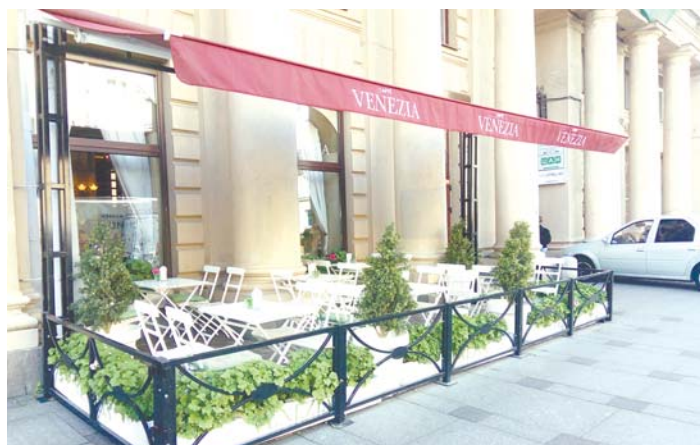
2-е место — кафе «Венеция»