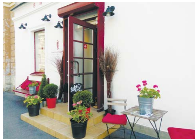
«Винная лавка № 1» заняла почетное 3-е место