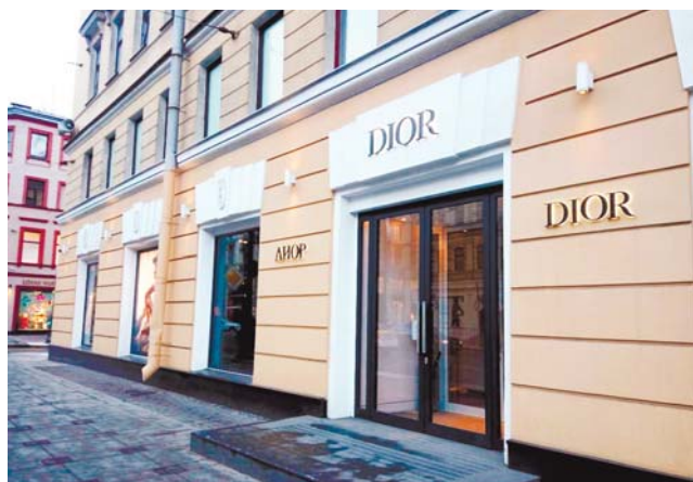
1-е место — витрине бутика на Невском проспекте