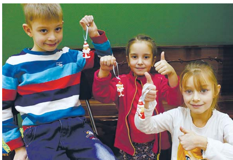
На кружке по лепке из полимерной глины

— Да, я читала о том, как жили смолянки. У нас дома в принципе та же дисциплина. Наши дети не боятся ничего и не избалованы, то есть они понимают: если нужно трудиться — значит нужно. И если они сейчас многое будут воспринимать посерьезнее и ответственнее, то потом будет намного легче. Могу сказать по себе: если бы я не была такой дисциплинированной и собранной, то выжить в этом городе было бы тяжело. Каждый день борьба! И папа, хоть и питерский, во многих вопросах со мной согласен. Конечно, в кадетской школе дисциплина. Но дисциплина нужна! Ну и что, что «строгий»? Зато мы людьми выросли!